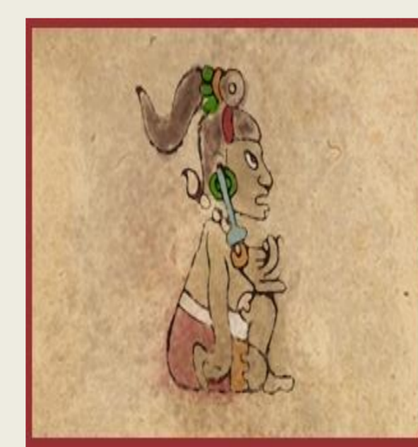
Diosa Maya Ixchel