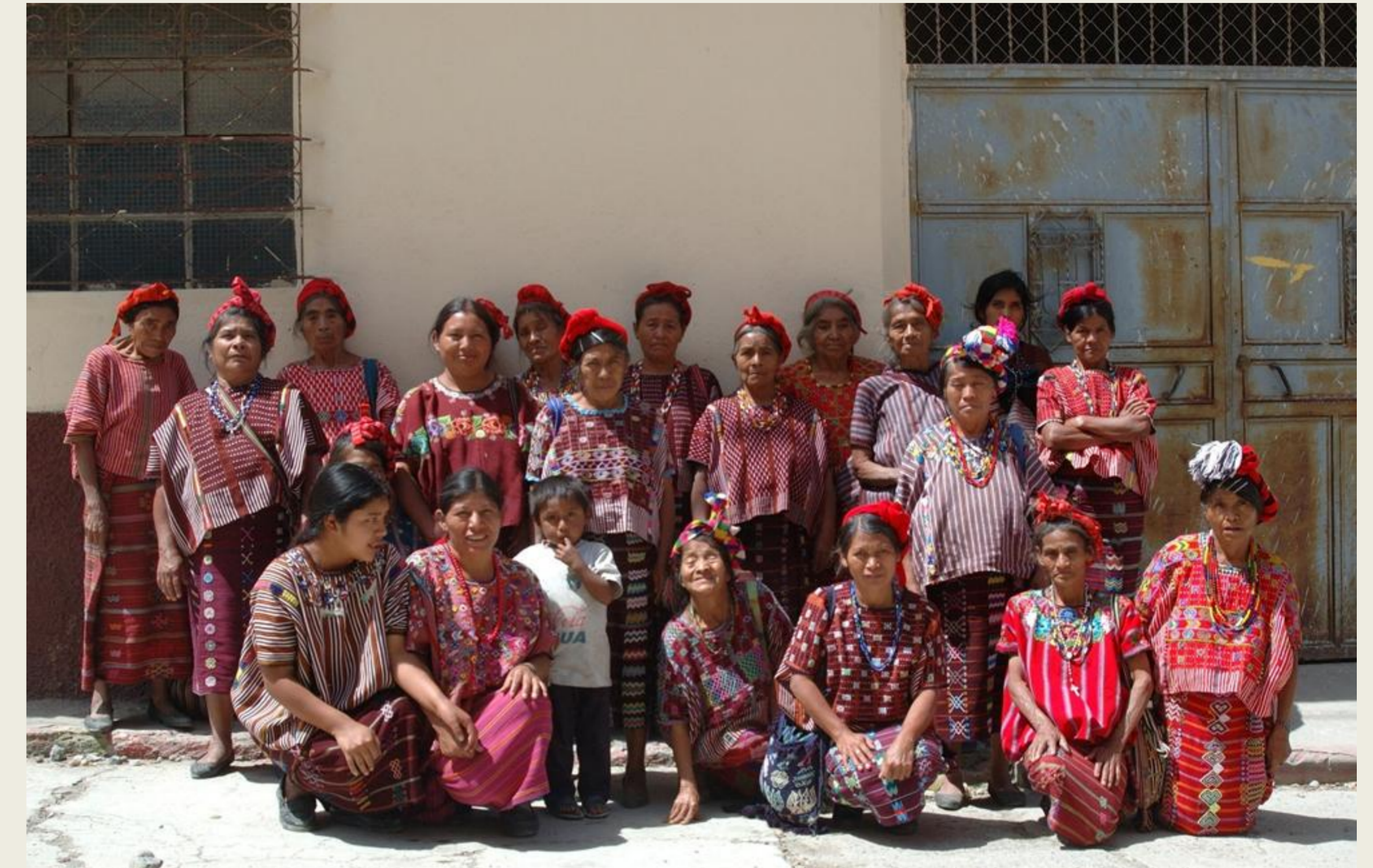
Comadronas de zona Mam, tras curso de capacitación