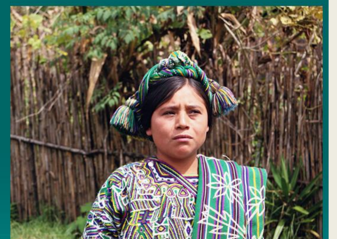
Kit, Turansa, zona Ixil