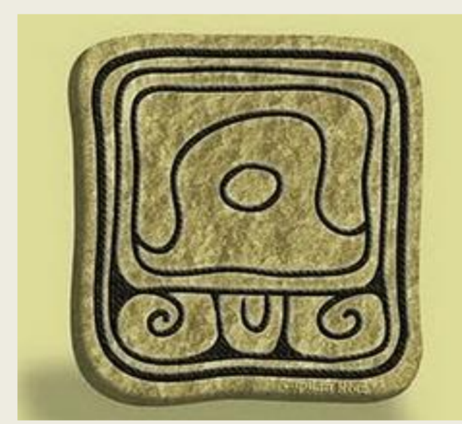
Glifo Maya de la LUNA